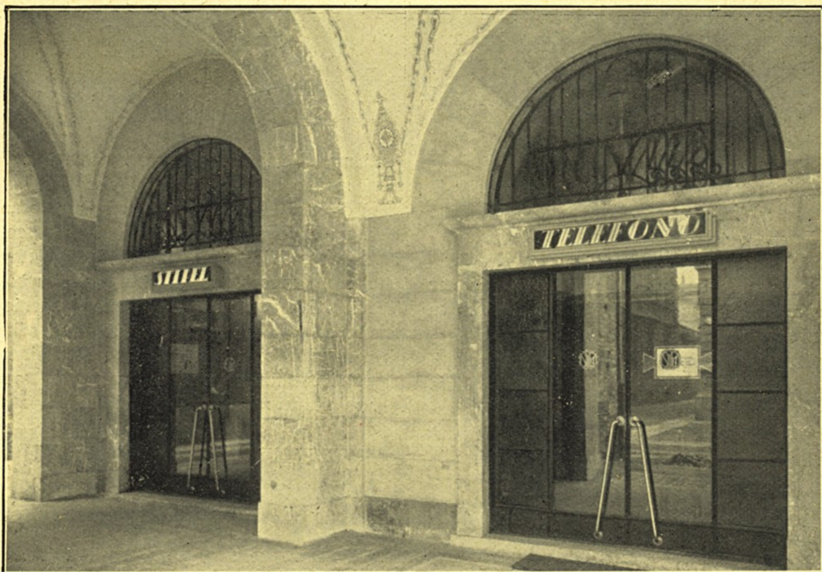
Il nuovo Ufficio di Accettazione di Pavia: Ingresso.

S. Pietro Berbenno - (Eserc. di Como) Rete di Sondrio, attivato Ufficio di estensione con