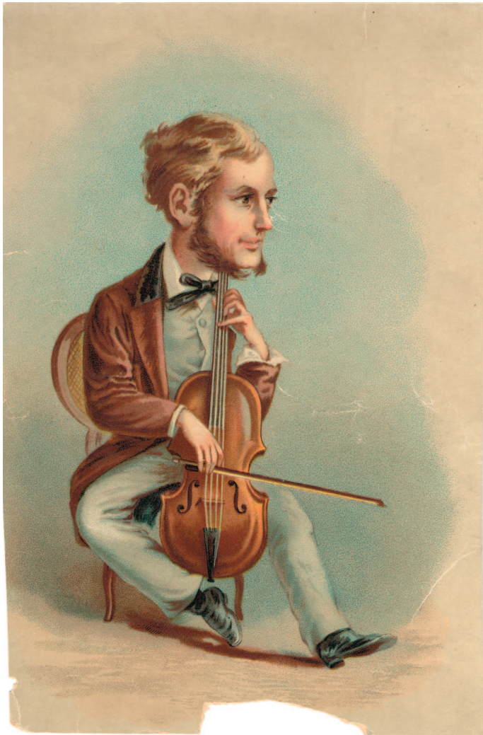
Anonimo, Suonatore di violoncello , stampa, sec. XIX-XX Collezione privata

invitata dai più importanti Festival in Europa, e ha suonato concerti per la Mainzer Musik Sommer di Mainz (Germania, 2016), la Baltic Philharmonia Season di Gdansk (Polonia, 2016), l'Alte Musik live Festival di Berlino (Germania, 2017), le Thüringer Bachwochen di Eisenach (Germania, 2017), il Vendsyssel Festival di Hjørring (Danimarca, 2018), le Innsbrucker Festwochen der Alte Musik di Innsbruck (Austria, 2018), il Casa dei Mezzo Festival a Makrighalos (Grecia, 2018). Armoniosa ha un'intensa attività discografica, iniziata nel 2015, quando è stata invitata a far parte del prestigioso catalogo della casa discografica tedesca MDG, con cui ha pubblicato La Stravaganza op. 4 di Antonio Vivaldi e le Trisonate per violino, violoncello e basso continuo di Giovanni Benedetto Platti (2016). Una nuova esperienza discografica è maturata nel 2017, con l'etichetta londinese Rubicon Classics, che ha prodotto le Sonate per violoncello e continuo op. 3 del violoncellista astigiano Carlo Graziani. La più importante stampa internazionale ha premiato queste incisioni con ottime recensioni. Nel 2019 è iniziata una nuova esperienza, con la creazione dell'etichetta RedDress distribuita da Sony Music in tutto il mondo, con la pubblicazione dell' Estro Armonico op. 3 di Antonio Vivaldi, alla quale sono seguite altre dedicate a capolavori di Johann Sebastian Bach.