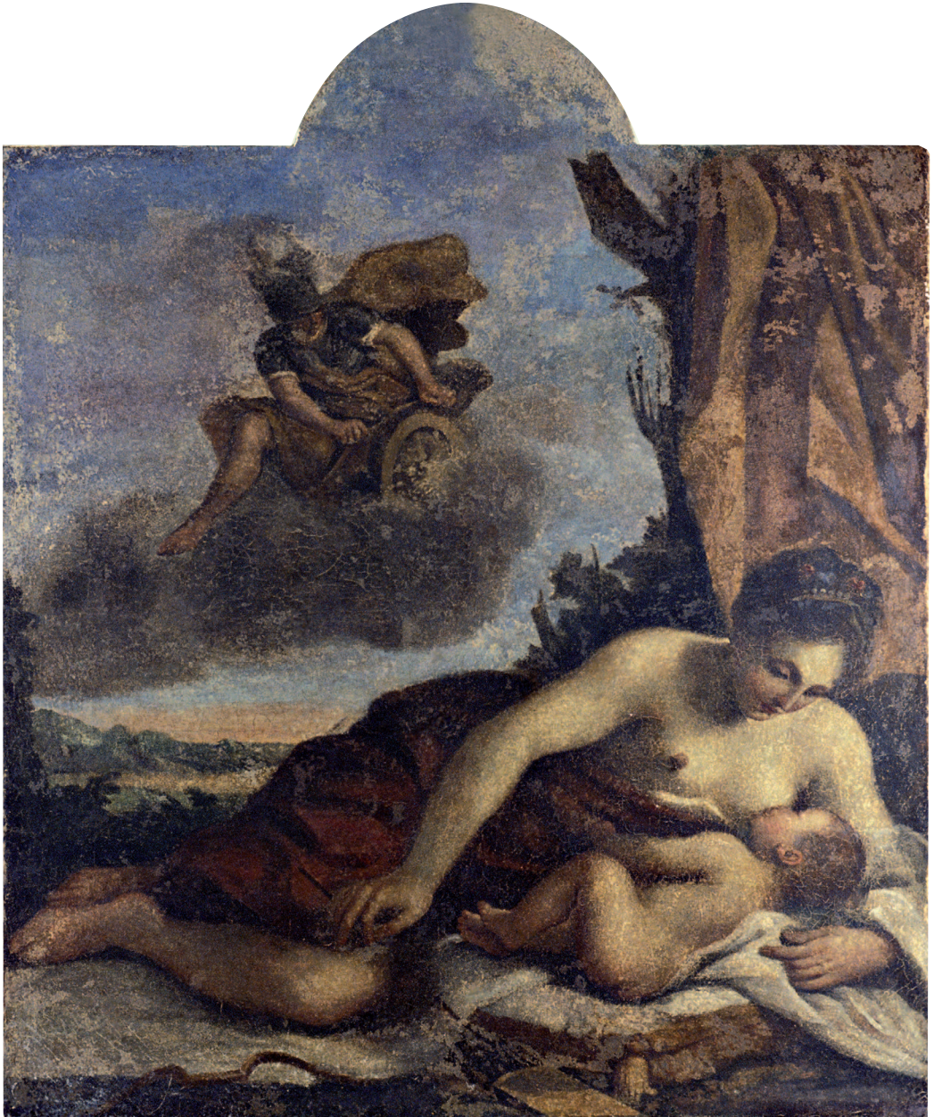
Giovanni Francesco Barbieri detto Il Guercino, Venere che allatta Amore , 1615-1617, affresco staccato Pinacoteca Civica Il Guercino, Cento

Se i languidi miei sguardi su testo di Claudio Achillini è, per usare le parole di Monteverdi, una lettera amorosa a voce sola in genere rappresentativo e si canta senza battuta . Tratta da Il settimo libro de Madrigali (Venezia 1619) può rientrare a buon diritto tra le pagine più illuminate del divin Claudio . Il testo di Achillini è certamente molto evocativo e l'idea di Monteverdi è che siano proprio le parole a guidare l'esecutore senza vincoli stretti con il tempo segnato sulla partitura, cosa molto più difficile da fare nei madrigali a più voci. Un solo cantante dunque che supplica il suo amore di leggere la lettera che