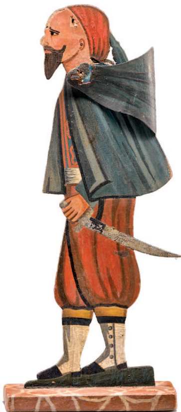
Igrometro , sec. XIX Museo Civico, Modena