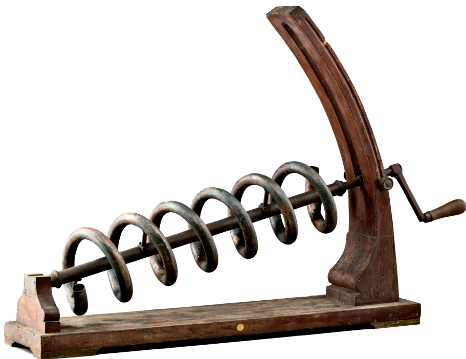
Vite di Archimede, secoli XVIII e XIX Museo Civico, Modena