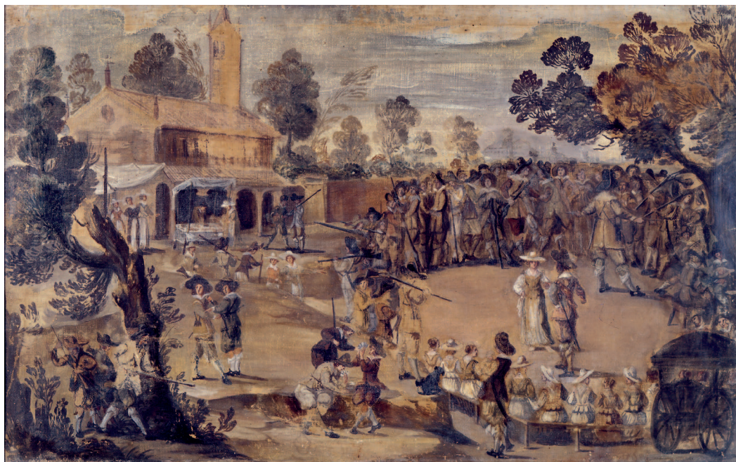
Giovanni Francesco Barbieri detto Il Guercino, Paesaggio con festa di paese , 1615-1620 Pinacoteca Civica Il Guercino, Cento