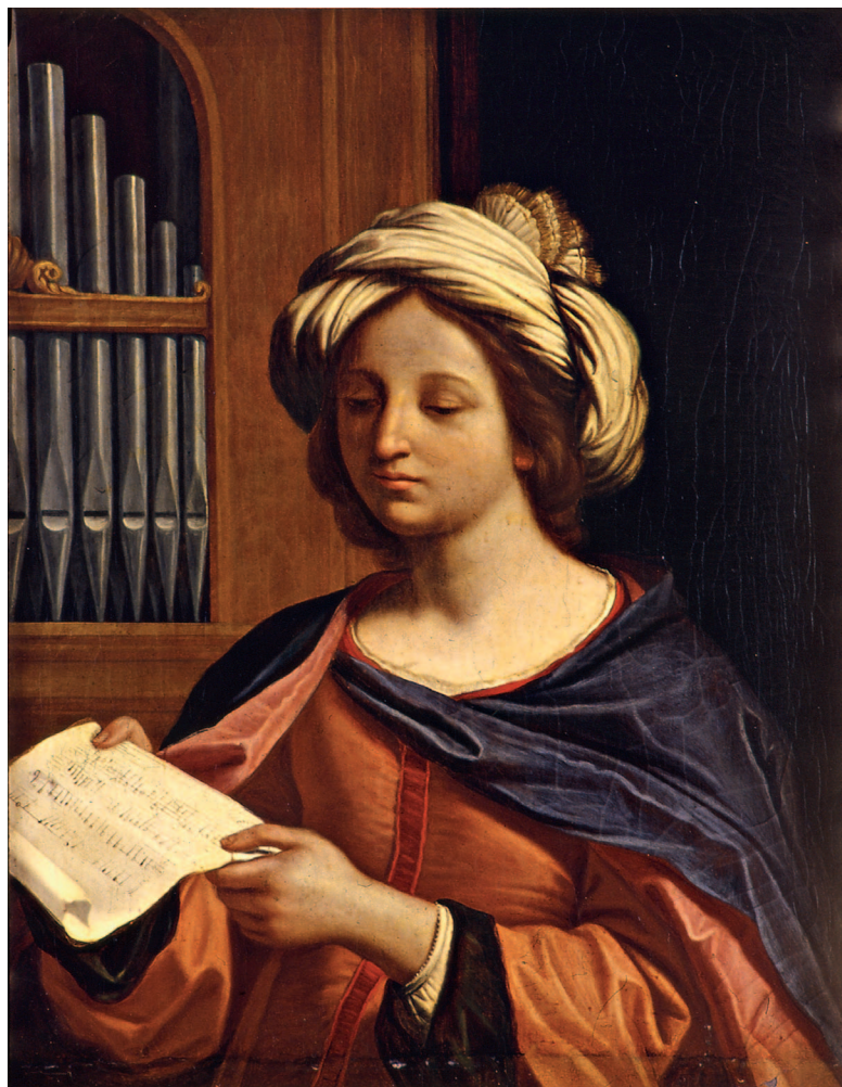
Giovanni Barbieri detto il Guercino, Santa Cecilia Pinacoteca Civica Il Guercino, Cento