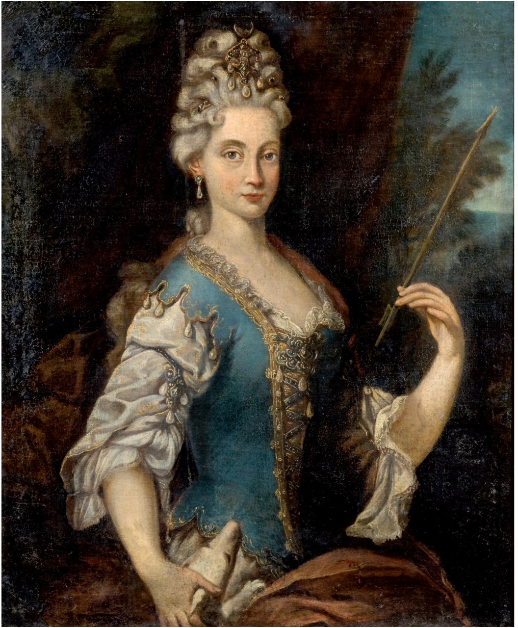
Pittore della prima metà del XVIII secolo, Carlotta Anglae d'Orléans Museo Civico, Modena