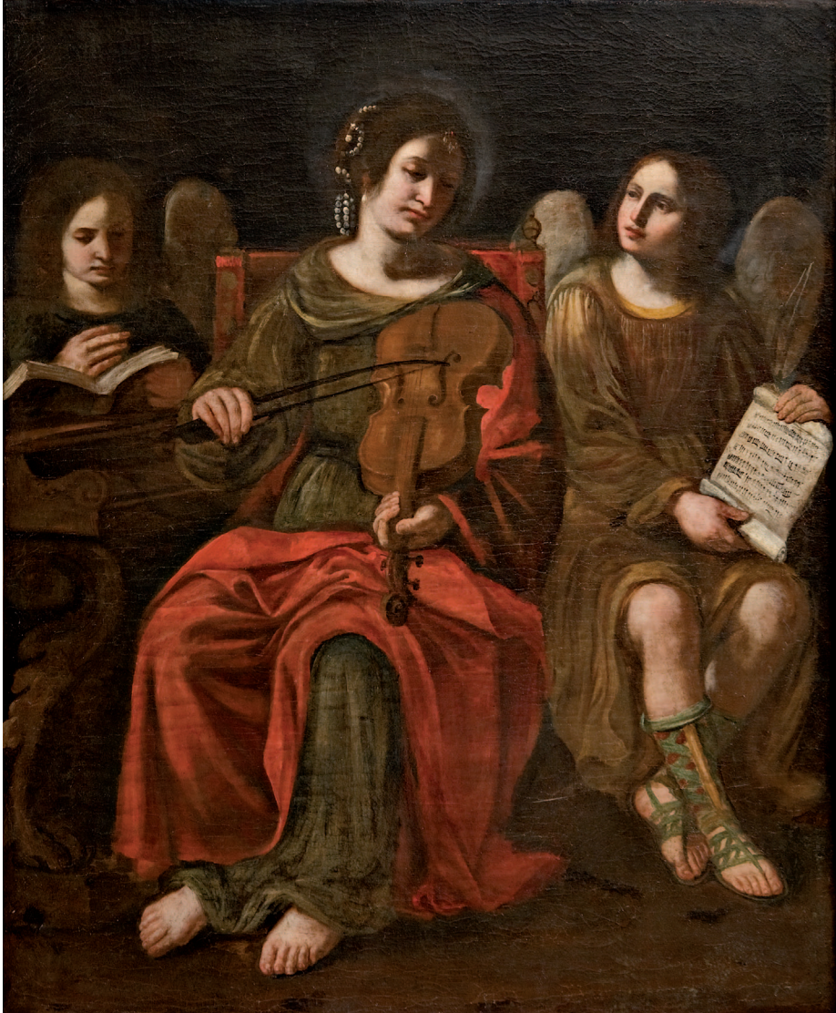
Giovanni Francesco Barbieri detto Il Guercino, Suonatrice di violino (Santa Cecilia) , 1640-1650 Pinacoteca Civica Il Guercino, Cento