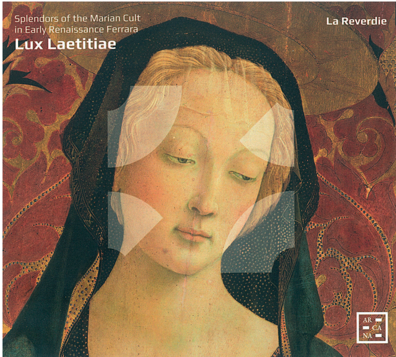
Lux Laetitia, Splendors of the Marian Cult in Early Renaissance Ferrara, cd Arcana, 2022, realizzato in collaborazione fra LaReverdie e Grandezze & Meraviglie