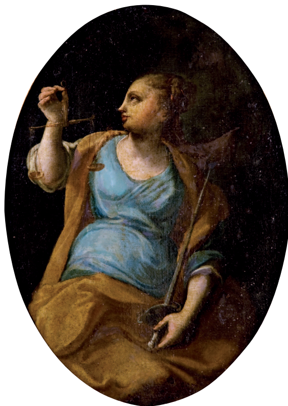
Pittore ligure (?), La Giustizia Museo Civico, Modena.

Testi tratti da documenti d'archivio originali elaborati da Francesca Ballico e Candace Smith