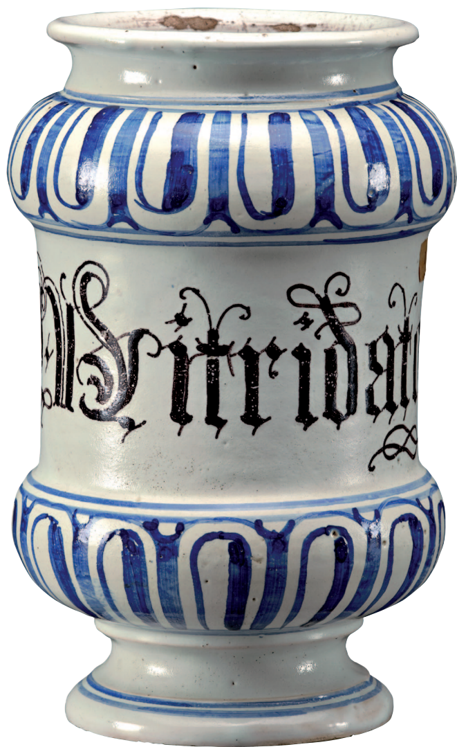
Manifattura Manardi, Bassano del Grappa, Albarello, Maiolica , secoli XVII e XVIII Museo Civico, Modena