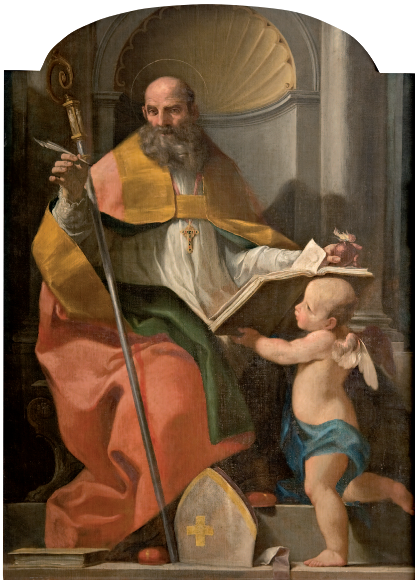
Atanasio Favini, Sant'Agostino , 1783 Pinacoteca Civica Il Guercino, Cento