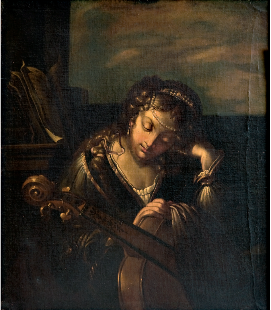
Ambito bolognese, Suonatrice di violoncello , 1690-1710 Pinacoteca Civica Il Guercino, Cento