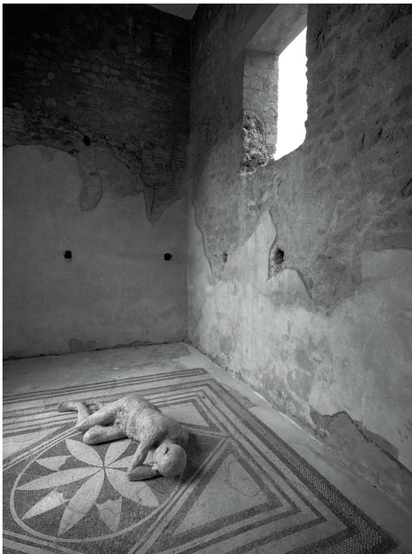
Casa dei Mosaici Geometrici 2) – Kenro Izu, Pompei, Casa dei Mosaici Geometrici (POM 114, dalla serie “Pompeii Requiem”), 2016, © Kenro Izu, Fondazione di Modena, Fondo Testi – FMAV Fondazione Modena Arti Visive

internazionali ( Diapason d’Or , 5 Diapason , Disco del Mese di Amadeus , Pizzicato Supersonic Award , Appoggiature d’or ). Collabora regolarmente con Il Giardino Armonico , I Barocchisti , Les Musiciens du Louvre , Balthasar-Neumann Ensemble , Arcangelo , Les Musiciens du Prince , Akademie für Alte Musik Berlin , Coro e Orchestra Ghislieri , Sheridan Ensemble , Cecilia Bartoli . Come solista ha un repertorio che va dal Medioevo al tardo Settecento e ha registrato un lavoro dedicato al grande chitarrista seicentesco Francesco Corbetta ( Dynamic ). Come direttore esperto in polifonia antica collabora con diverse formazioni tra cui Capella Cracoviensis e Harmonia Cordis . Ha suonato in oltre 70 dischi (per Deutsche Grammophon , Decca , EMI/Virgin Classics , Alpha Classics , Naïve , Sony/Deutsche Harmonia Mundi , SWR , Glossa , Ricercar , Avie , The Classic Voice , Amadeus ) e ha preso parte a numerose trasmissioni radiotelevisive ( BBC , Rai Radio 3 , ORF , WDR , Radio Polskie , Rete 2 della Rsi , France 2 , France Musique , Mezzo ).