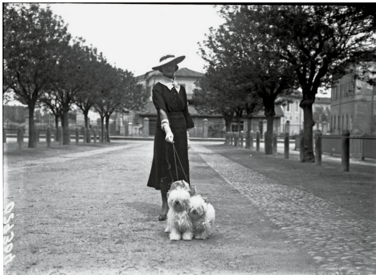
Ferruccio Testi, Modena, Viale Monte Kosica, Esposizione canina all'interno del vecchio mercato bestiame Fondazione di Modena, Fondo Testi – FMAV Fondazione Modena Arti Visive