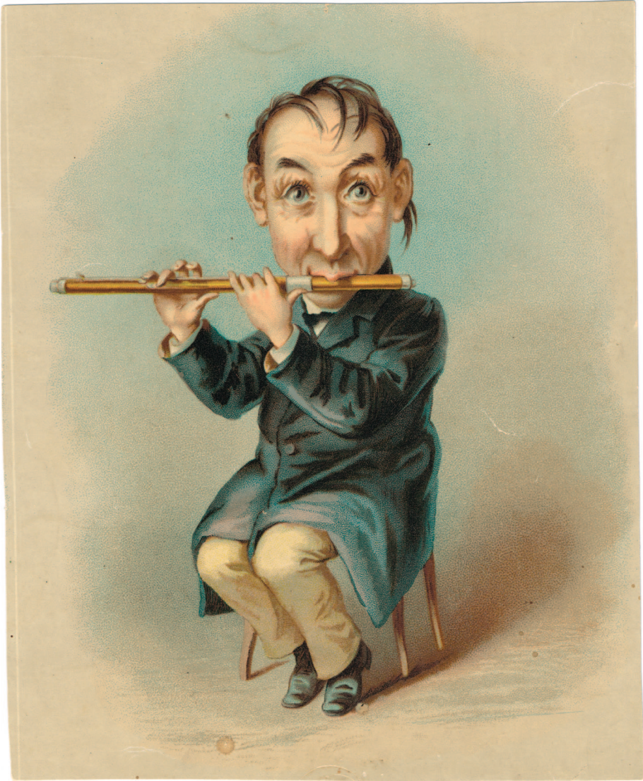
Anonimo, Suonatore di flauto traversiere , stampa, sec. XIX-XX Collezione privata