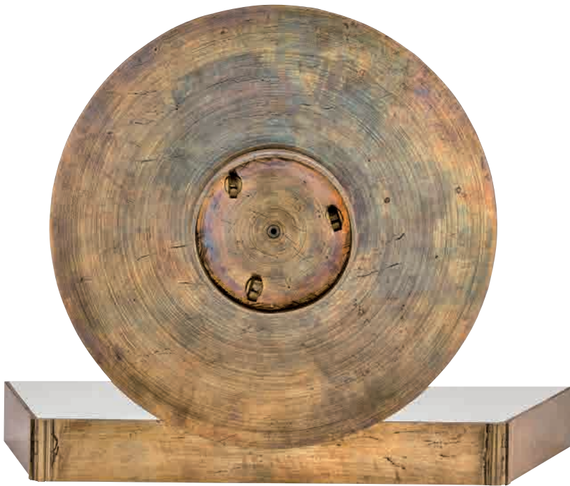
Bussola topografica (1690-1699), Modena, Museo Civico d'Arte