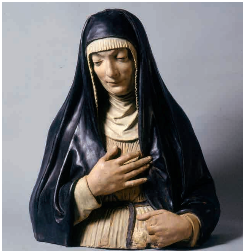
Nicolò dell'Arca (attr.) (Bari, 1435/1440 – Bologna, 1494) Santa monaca sec. XV (ca. 1480) Modena, Galleria Estense