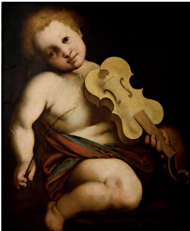
Ambito piemontese (?); altra attribuzione: Bernardino Lanino o Pietro Grammorseo Putto sec. XIX, Modena, Museo Civico d'Arte