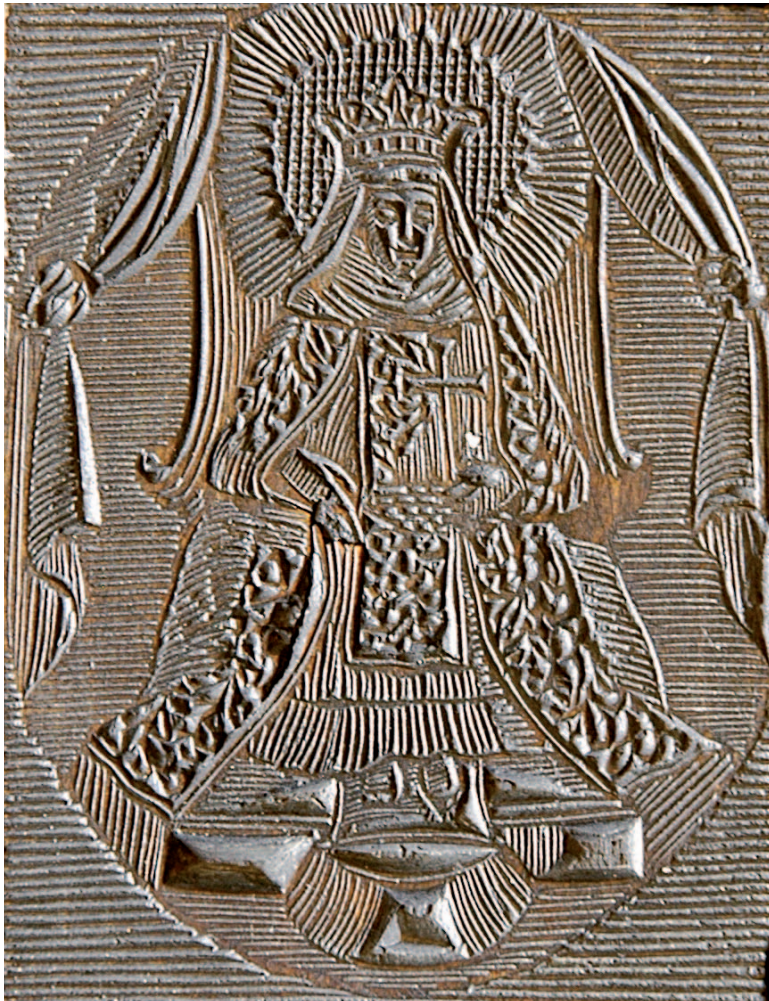
Ignoto, Santa Caterina Vigri , matrice, secc. XVII-XVIII, Modena, depositi della Galleria Estense