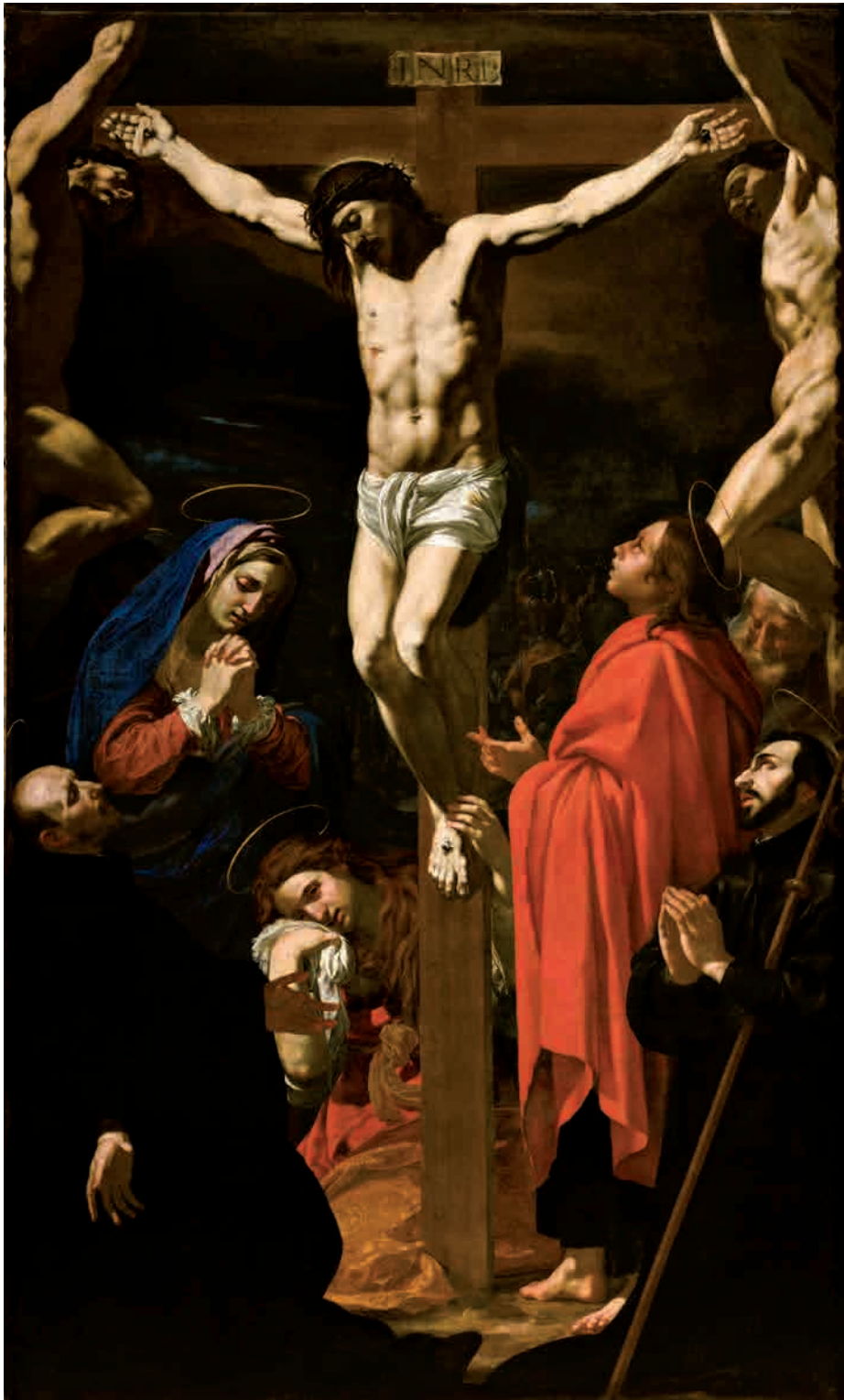
Antonio Circignani detto Pomarancio (1567/70 ca.-1630), Crocifissione con san Francesco Saverio e sant'Ignazio di Loyola , Modena, Galleria Estense