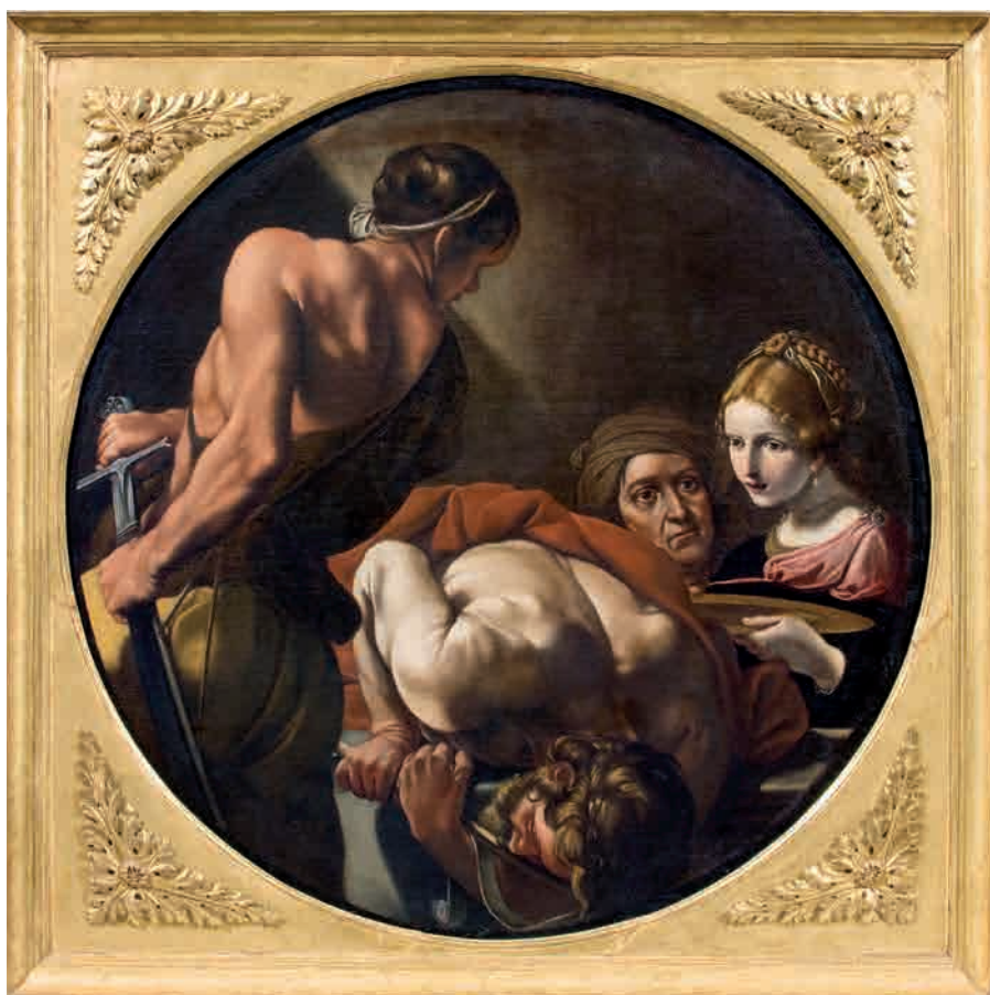
Alessandro Tiarini (1577-1668) Decollazione del Battista sec. XVII (1600-1650), Modena, Museo Civico d'Arte