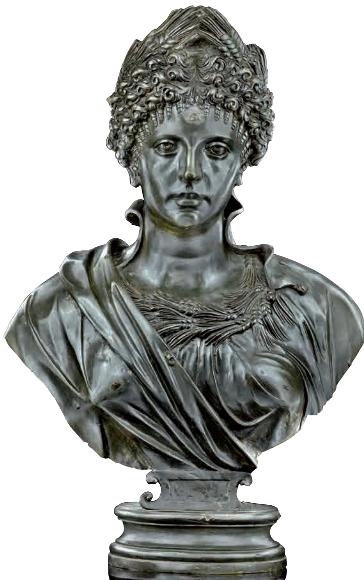
Ludovico Lombardo (Ferrara, 1507/08 – 1575) Cerere , Modena, Galleria Estense

elemento questo che viene ripreso nel Presto conclusivo; l' Adagio centrale invece viene costruito come una costellazione di suoni ed elementi che compaiono e scompaiono su note ribattute in vari registri. Dopo quest'introduzione, la voce inizia a cantare in un recitativo accompagnato dagli strumenti che ne potenziano la drammaticità sfociando nella seguente aria "Come mai puoi". In quest'aria con da capo Marcello mostra le sue doti di compositore e la grande sensibilità per i testi intrecciando la linea melodica alternata tra violini con il canto della voce, arricchendo il disegno con dissonanze su parole chiave come "crudel" o "morte". Gli abbellimenti sono limitati e non stravolgono con eccessive ripetizioni la metrica e il testo, com'era invece comune nella musica coeva e per questo fortemente criticata dal compositore stesso nel citato trattato Il teatro alla moda . Segue il successivo recitativo secco, cioè con il solo accompagnamento del basso continuo, che porta all'aria finale, sempre con da capo, in tempo veloce. Nella cantata "Qual turbine" le immagini naturali del