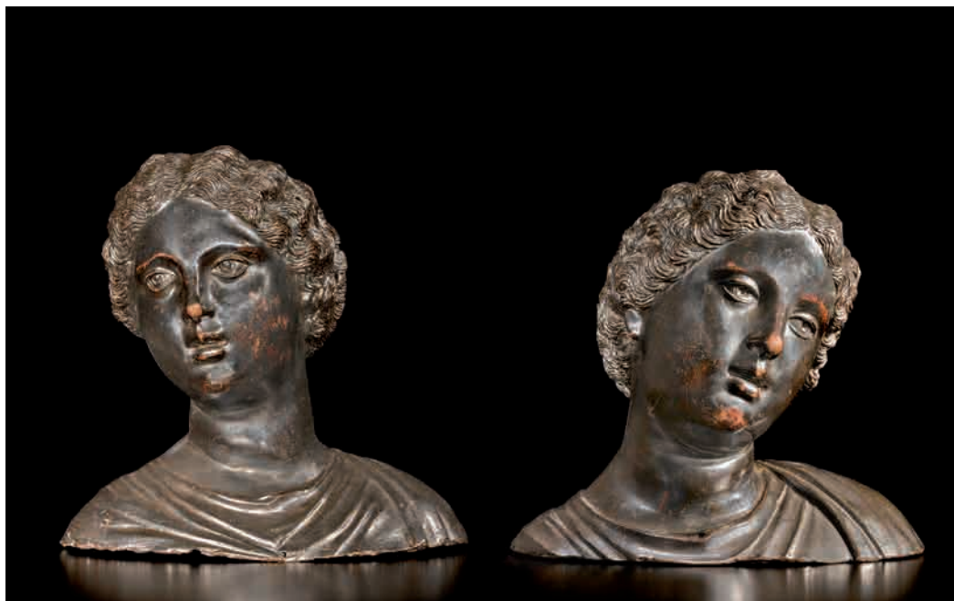
Antonio Lombardo (Venezia, 1475 ca.-Ferrara, 1516) Teste femminili, Modena, Galleria Estense