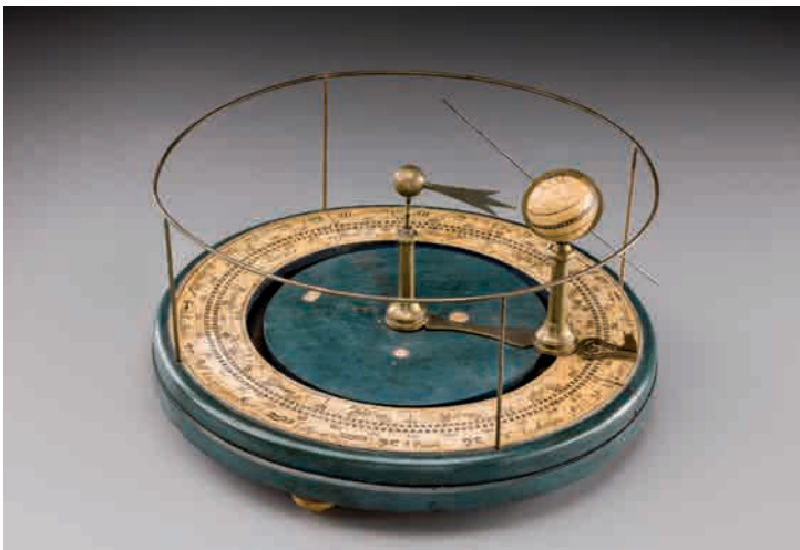
Planetario (tellurio) secc. XVIII/ XIX 1790-1810, Modena, Museo Civico d'Arte