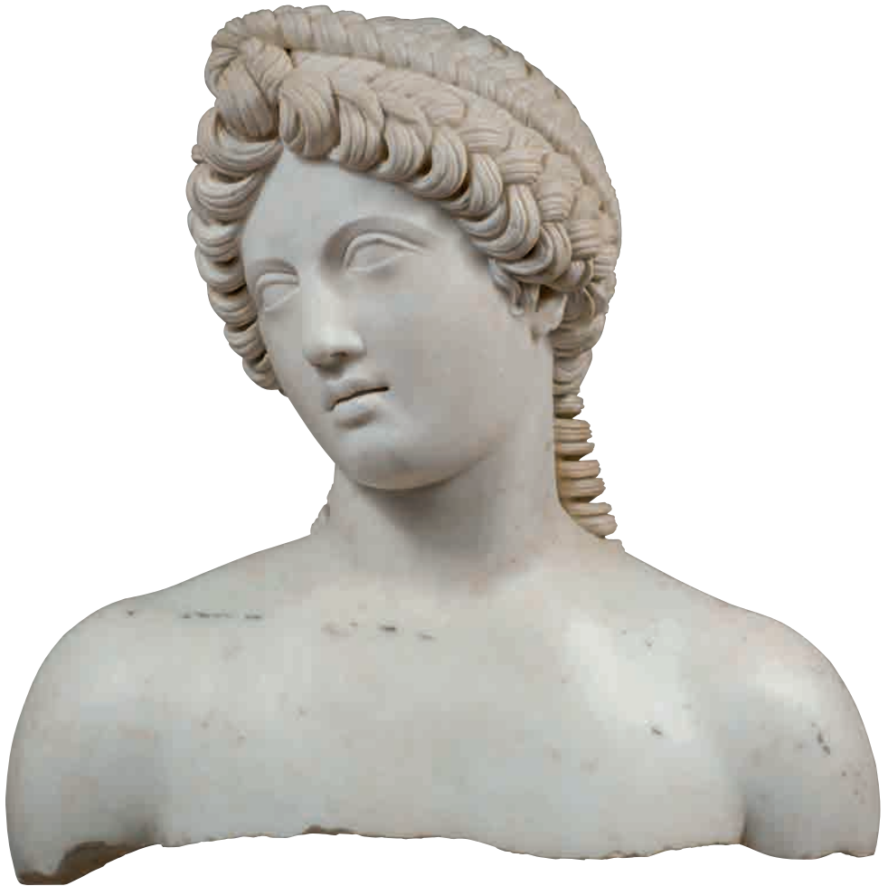
Seconda metà del XVII sec-Busto di Apollo rilavorato da figura alata, Sassuolo, Palazzo Ducale