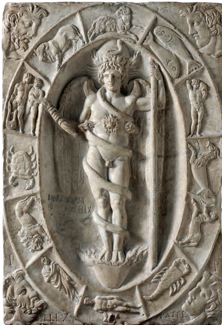
Arte romana secondo venticinquennio del II secolo d.C. Rilievo con Aion/Phanes entro Zodiaco Modena, Galleria Estense