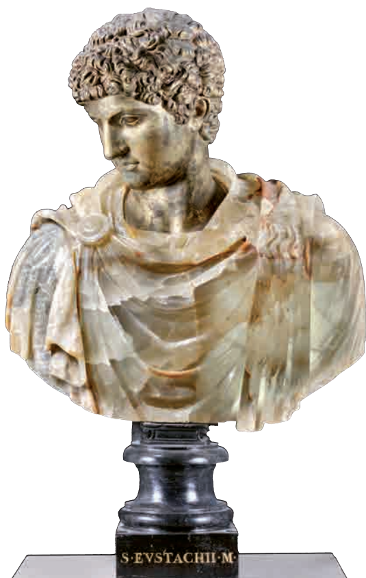
Sec. XVIII (post prima metà 1700-ante 1749) Busto di Antinoò , Modena, Galleria Estense

PROLOGO. Avvertito da Apollo della passione adulterina che si andava consumando fra Marte e Venere, sua sposa, Vulcano ha sorpreso in flagrante gli amanti fedifraghi imprigionandoli in una rete di ferro portentosa. In ragione della sua delazione, Apollo ha attirato su di sé l'astio pernicioso e inesorabile della dea dell'amore, cosicché scende in terra fiammeggiante d'ira meditando vendetta: separerà Venere dal suo nuovo amante, il giovane e bellissimo cacciatore Adone, nato dalla passione incestuosa di Mirra per il padre Cinira, re di Cipro; realizzerà questo proposito con l'aiuto dello