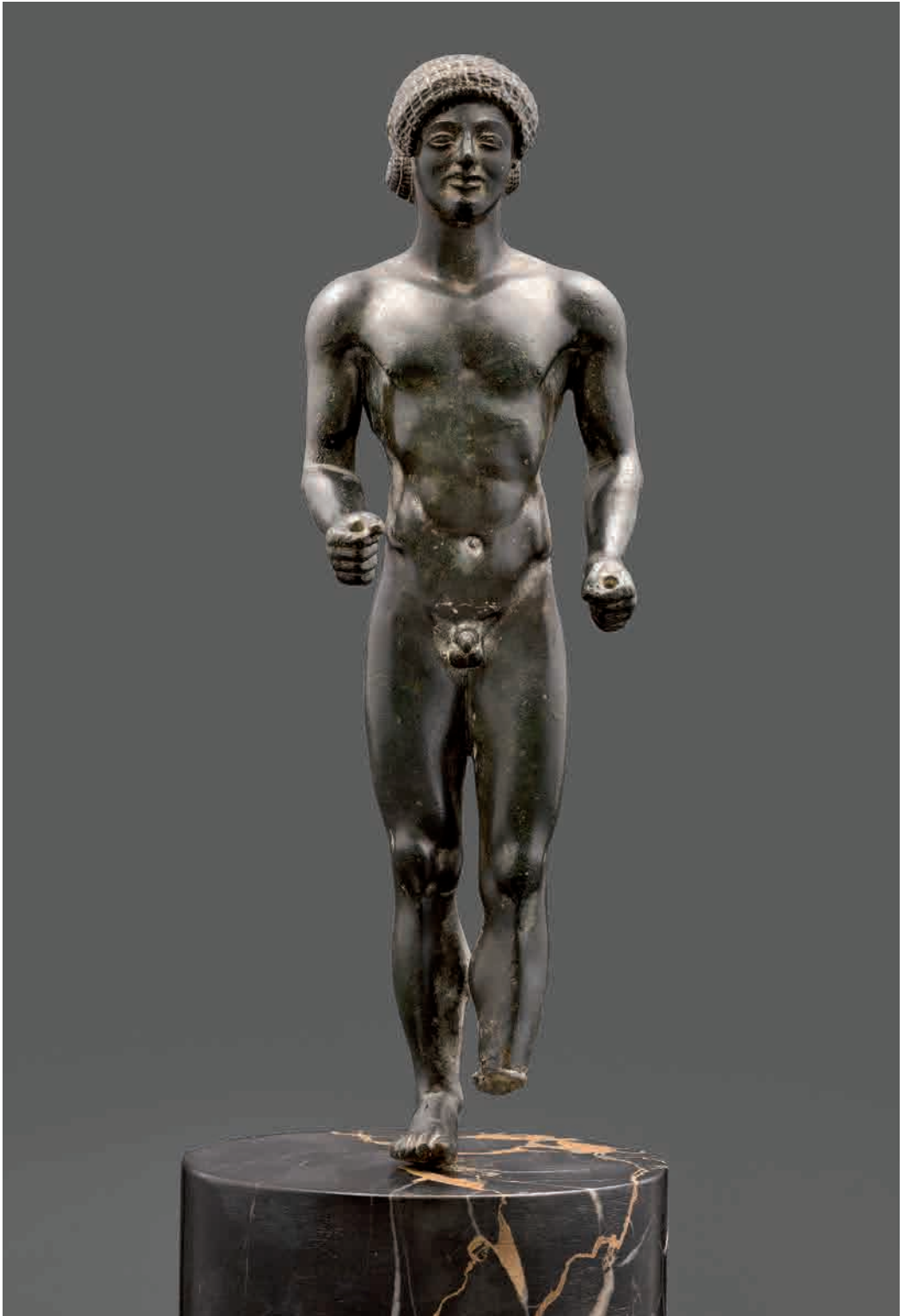
Arte greca inizi V secolo a.C Kouros , Modena, Galleria Estense