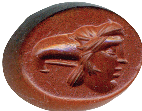
Secc. I/ II (ca. 0-ca. 199) Gemma con doppia testa (aquila e maschera) , Modena, depositi della Galleria Estense