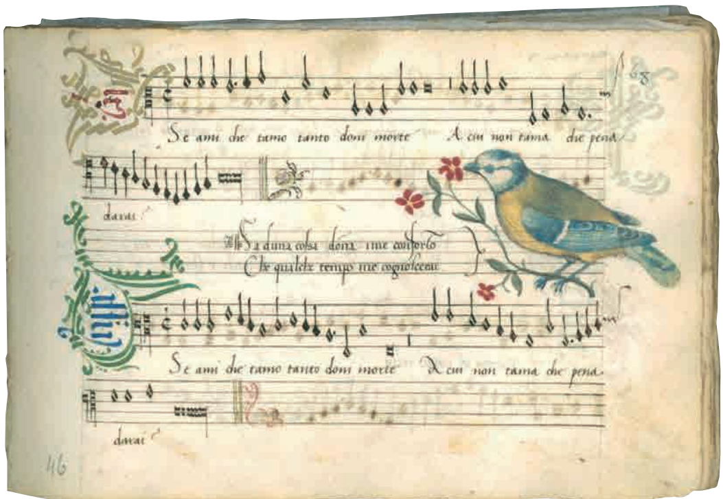
Composizionii profane, Sec. XVI, Modena Biblioteca Estense Universitaria (Mss. Mus. alfa.f.9.9)

32. Ma sovr'ogni augellin vago e gentile / che più spieghi leggiadro il canto e'l volo / versa il suo spirto tremulo e sottile / la sirena de' boschi, il rossignuolo, / e temprà in guisa il peregrino stile / che par maestro del'alato stuolo. / In mille fogge il suo cantar distingue / e trasforma una lingua in mille lingue. // 33. Udir musico mostro, o meraviglia, / che s'ode sì, ma si discerne apena, / come or tronca la voce, or la ripiglia, / or la ferma, or la torce, or scema, or piena, / or la mormora grave, or l'assottiglia / or fa di dolci groppi ampia catena, / e sempre, o se la sparge o se l'accoglie / con egual melodia la lega e scioglie. // 34. O che vezzose, o che pietose rime / lascivetto cantor compone e detta. / Pria flebilmente il suo lamento esprime, / poi rompe in un sospir la canzonetta. / In tante mute or languido, or sublime / varia stil, pause affrena e fughe affretta, / ch'imita insieme e'nsieme in lui s'ammira / cetra flauto liuto organo e lira.