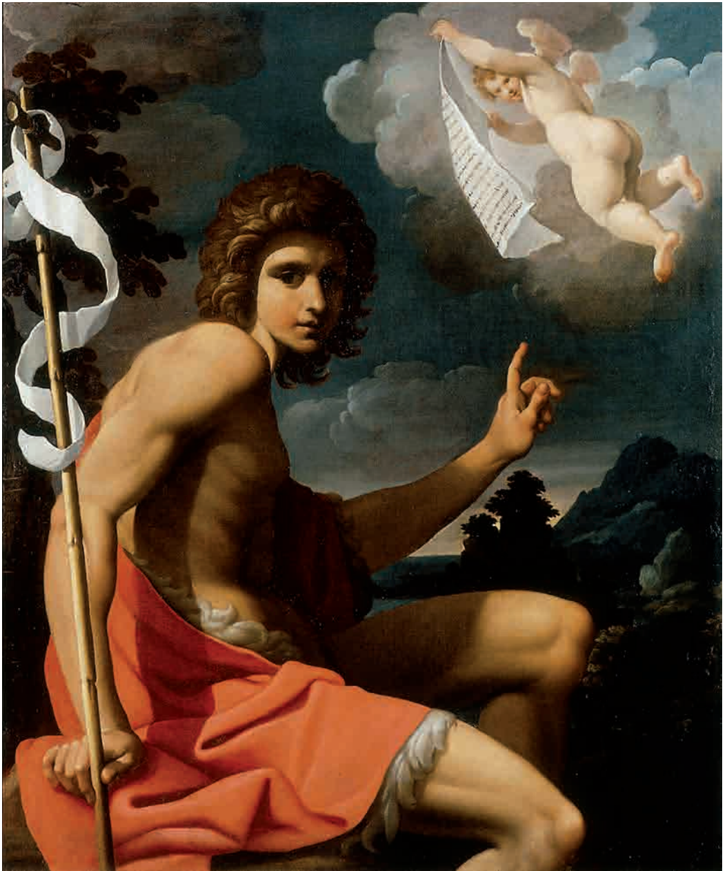
Bartolomeo Schedoni (1578-1615) San Giovanni (1604-1607), Modena, Museo Civico d'Arte