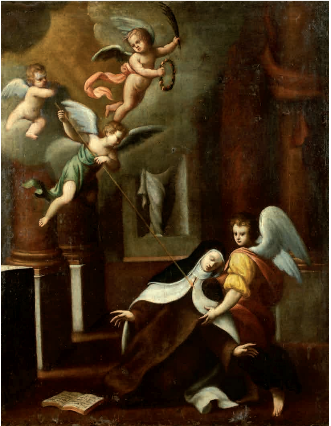
Santa Teresa d'Avila ha la visione dell'Angelo che le trafigge il cuore con una freccia ardente Sassuolo, Palazzo Ducale