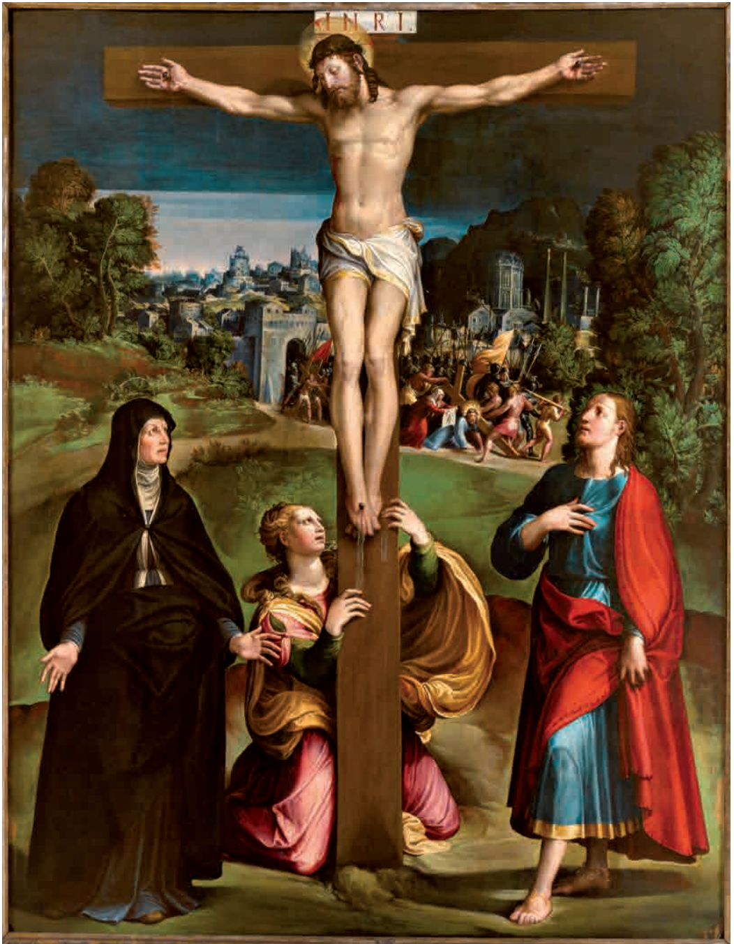
Nicolò Dell'Abate (Modena, 1509 ca.-Fontainebleau, 1571) Crocifissione sec. XVI (ca. 1539-1539) Modena, Galleria Estense