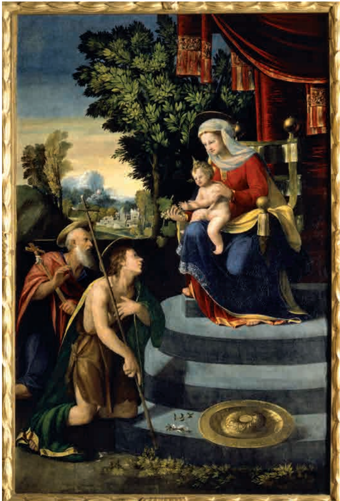
Luteri Battista di Niccolò detto Battista Dossi (Ferrara, notizie dal 1517-m. 1548) Madonna in trono col Bambino e i santi Girolamo e Giovanni Battista sec. XVI (ca. 1530-ca. 1540) Ferrara, Pinacoteca Nazionale

composizioni che hanno uno scopo più materiale. Le sonate di Telemann infatti fanno parte delle Sonate Metodiche , una raccolta di dodici composizioni scritte per violino o flauto e basso continuo e dedicate ai numerosi musicisti amatoriali di Amburgo. Nonostante i destinatari non siano professionisti, queste composizioni presentano una scrittura elaborata ed elegante, con movimenti rapidi di carattere giocoso e movimenti lenti cantabili e malinconici. Questi ultimi presentano un doppio pentagramma per la voce principale: uno con la melodia e un secondo con la medesima linea ma arricchita da elaborati abbellimenti nello stile italiano o francese così che l'esecutore possa suonare direttamente la linea arricchita se non in grado di improvvisarla com'era prassi. Questo, insieme alla terminologia descrittiva utilizzata per indicare i movimenti (il "Cunando", ossia cullando, ne è un esempio), dimostra la cura che Telemann ha posto nella composizione di queste musiche affinché musicisti non professionisti potessero suonarle e interpretarle nel modo corretto. Vicino in alcuni passaggi allo stile di Telemann è la sonata in Si minore di Bach. In questa composizione c'è un allontanamento dalle convenzioni della sonata barocca, sfruttando la possibilità di costruire due linee indipendenti per il clavicembalo: una per la mano destra che dialoga a pari importanza col flauto, mentre la seconda per la sinistra con funzione di basso. Il Presto è un'elaborata fuga a