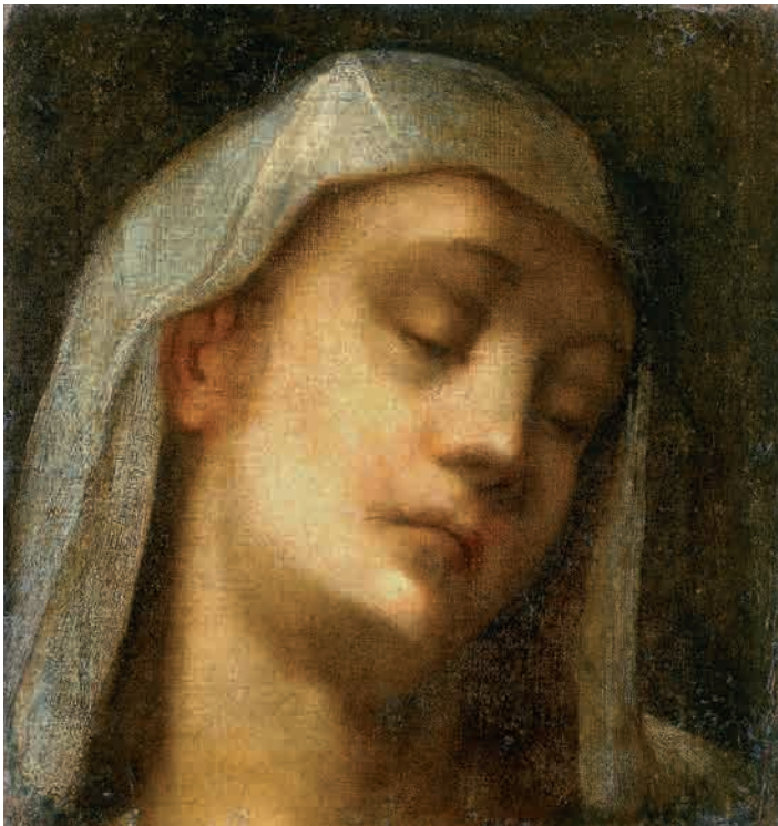
Ambito romano (?), altra attribuzione Sebastiano del Piombo Addolorata (1590-1599) Modena, Museo Civico d'Arte